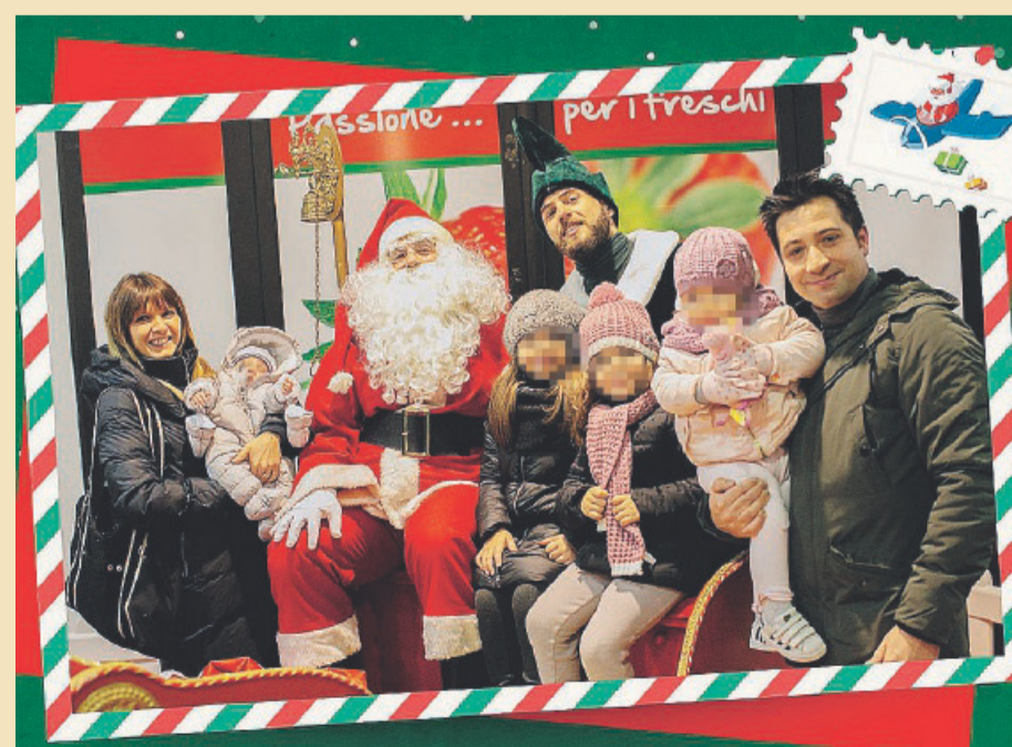
BABBO NATALE Foto e doni per la gioia dei più piccoli e grandi

La magia del Natale diventerà realtà per grandi e piccini che potranno stringersi a Babbo Natale in persona.