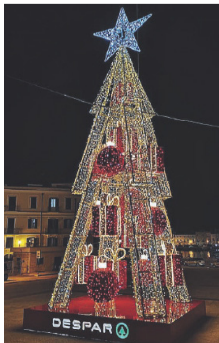
«TRANI T'INCANTA» Il grande albero Despar in piazza Quercia

Tra tutti gli utenti partecipanti verranno estratti entro il 31 Gennaio 2020 i vincitori che si aggiudicheranno in totale n. 1 Buono spesa Despar Maiora del valore di euro 50,00 cad. e n.1 Gift box con prodotti a marchio Despar del valore di euro 50,00 cad.