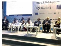
Il Ciheam Bari protagonista alla 40esima edizione del Meeting di Rimini. Il tema scelto è stato: Meno fragili, più uguali