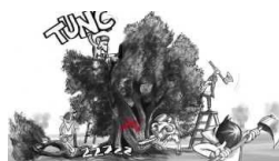
#noXylella lo spot di @ilikepuglia