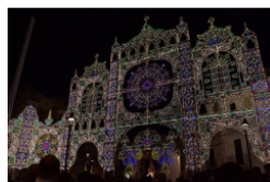
Paulicelli Light Design dalla Puglia in tutto il mondo