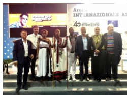
Il Ciheam Bari protagonista alla 40esima edizione del Meeting di Rimini. Il tema scelto è stato: Meno fragili, più uguali