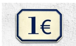
Mutuo Casa Numero 1. Il mutuo numero 1 di nome e di fatto