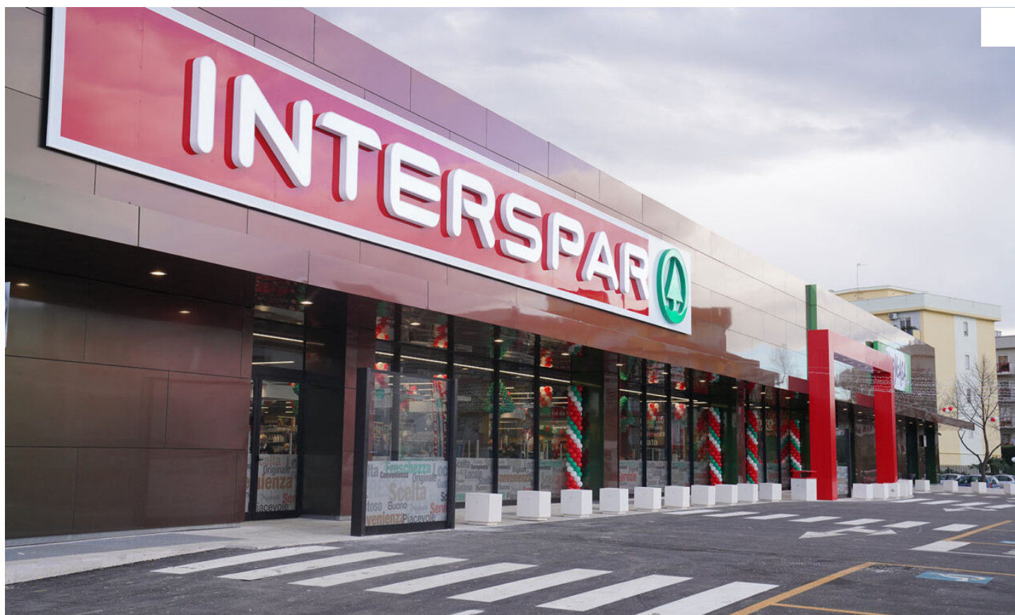
Un punto vendita Interspar

Nel 2021 raggiunti i 22 milioni di utili