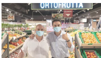
Pescara, Despar Centro-Sud apre il nuovo Eurospar e avvia la crescita in Abruzzo In "Comunicati Stampa"