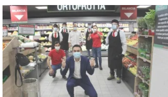
Despar Centro-Sud, cresce la customer experience all'Interspar di Scalea (CS) In "Comunicati Stampa"