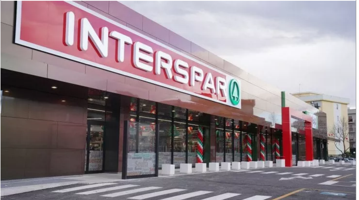
Un ipermercato della rete Maiora-Despar

Maiora-Despar, altre 100 assunzioni al Centro-Sud entro il 2023. E il giro d'affari si chiude a un miliardo di Cenizio Di Zanni