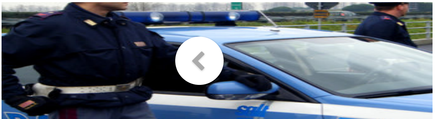
Trasporto alimenti, la polizia non può accertare le violazioni