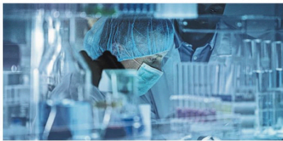
▲ Hi-tech Start Cup Puglia 2021 è stata organizzata da ARTI

Alimenti speciali brevettati e dotati di efficacia farmaco-nutrizionale in grado di contribuire a una migliore qualità di vita del paziente nei corsi di trattamenti oncologici, durante il percorso di lotta contro il cancro e a seguito della guarigione. È questa l'idea progettuale del team di FlavioLife, vincitore assoluto di Start Cup Puglia 2021. La finale della competizione tra business plan innovativi è stata organizzata anche quest'anno da ARTI in collaborazione con Regione Puglia, Comitato promotore e PNI - Premio Nazionale per l'Innovazione e si è svolta al Cinepolo di Bari, in diretta sul canale youtube di ARTI e sul sito della manifestazione.