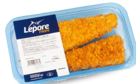
TRAPEZI DI MERLUZZO D'ALASKA AI CORNFLAKES 190G