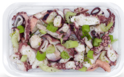
INSALATA POLPO E SEDANO 250G