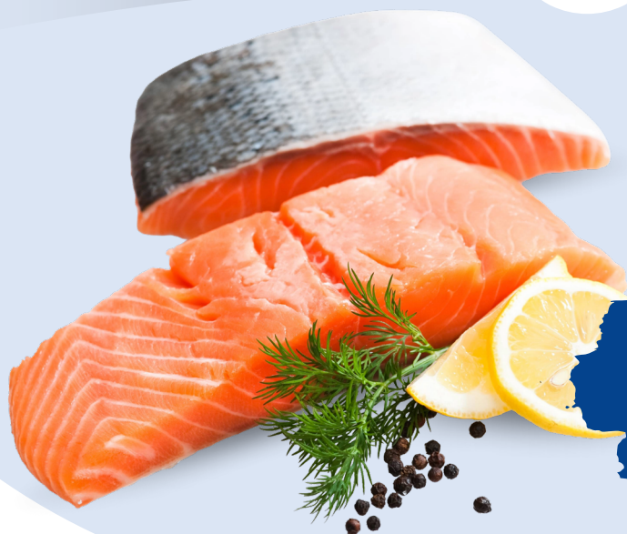
FILETTO DI SALMONE