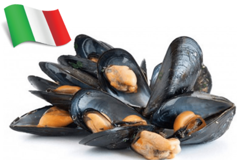
COZZE NERE SFUSE ALLEVATE IN ITALIA