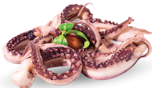
TENTACOLI DI TOTANO GIGANTE DEL PACIFICO DECONGELATI