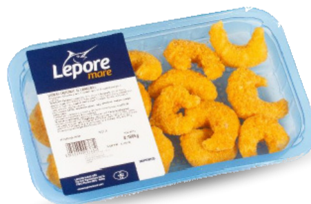
GAMBERI CROCCANTI AI CORNFLAKES 180G