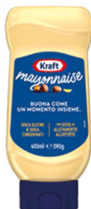
MAIONESE KRAFT 410ML