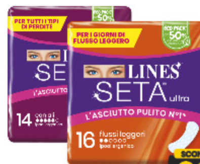
ASSORBENTI SETA ULTRA LINES VARI TIPI