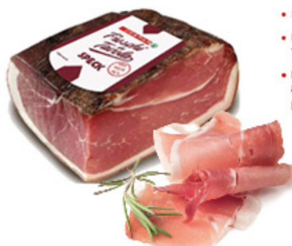
SPECK FRESCHI IN TAVOLA DESPAR ALL'ETTO