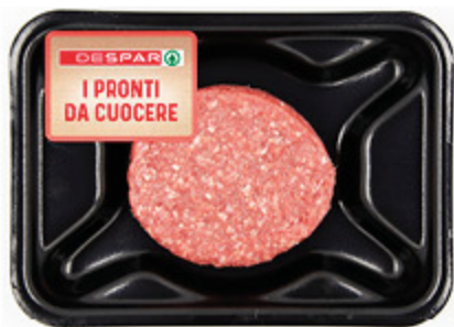
MAXI BURGER DI SCOTTONA (BOVINO ADULTO) DESPAR 200G