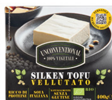
TOFU VELLUTATO BIOLOGICO UNCONVENTIONAL 400G