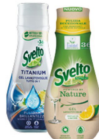
DETERSIVO LAVASTOVIGLIE GEL SVELTO VARI TIPI 640ML