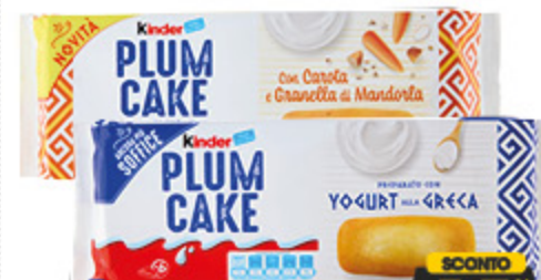
PLUMCAKE KINDER CON YOGURT ALLA GRECA/ CAROTE E MANDORLE X6 - 192G