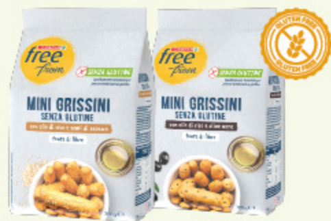
Mini grissini Despar Free From senza glutine classici/olive nere 200g