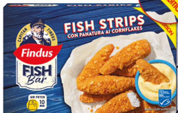
FISH STRIPS FINDUS FILETTI DI MERLUZZO PANATI AI CORNFLAKES 256G