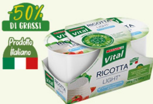
Ricotta light Despar Vital 2 x 100g