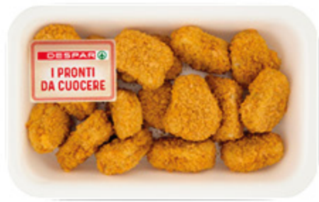
CROCCHETTE DI POLLO CON FORMAGGIO DESPAR 400G