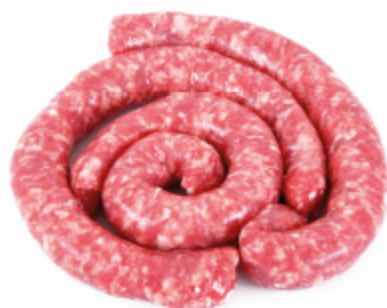
SALSICCIA MISTA BOVINO E SUINO AL KG