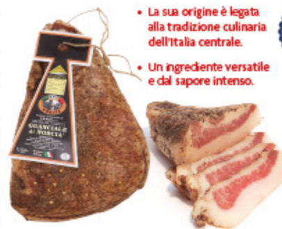
GUANGIALE DI NORCIA LANZI AL PEPE/ PEPERONCINO ALL'ETTO