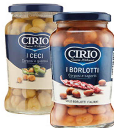
LEGUMI CIRIO CECI/ FAGIOLI BORLOTTI/ FAGIOLI CANNELLINI IN VETRO 370G