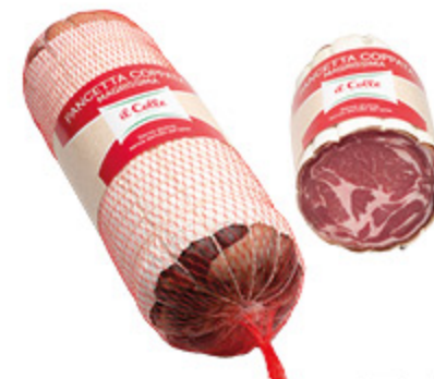
PANCETTA COPPATA MAGRISIMA IL COLLE ALL'ETTO