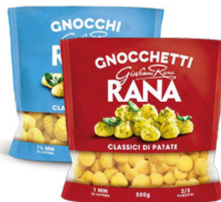
GNOCCHI/ GNOCCHETTI RANA CLASSICI DI PATATE 500G