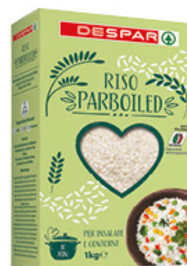
RISO FINO DESPAR PARBOILED 1KG

100% ITALIANO SCONTO 20% 1,75 / 1,75 € al kg