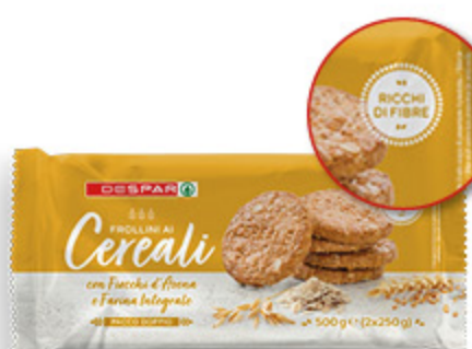
FROLLINI DESPAR AI CEREALI 500G