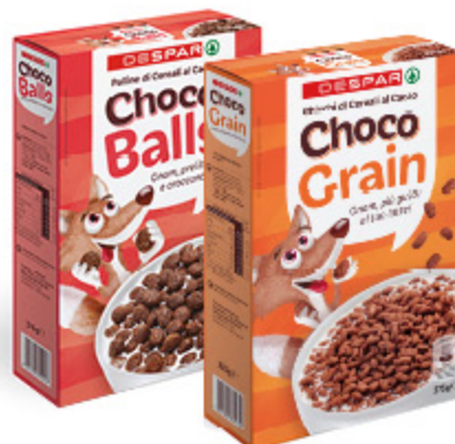
CEREALI DESPAR CHOCO BALLS/ CHOCO FLAKES/ CHOCO GRAIN 375G