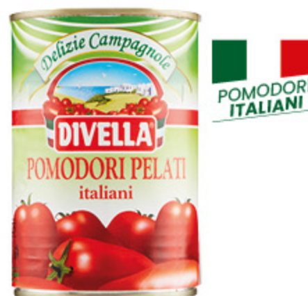
POMODORI PELATI DIVELLA 400G