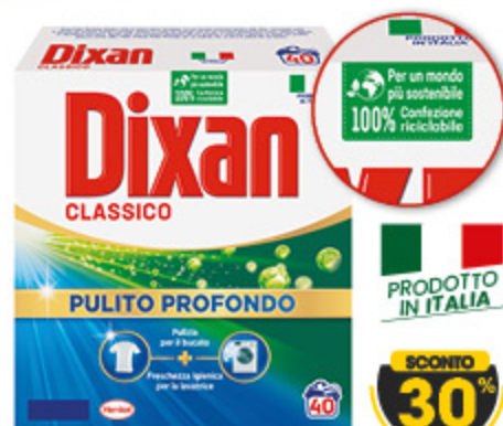
DETERSIVO LAVATRICE DIXAN IN POLVERE 40 MISURINI