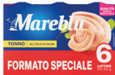
TONNO MAREBLÙ ALL'OLIO D'OLIVA 60G X6