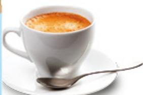
CIALDE COMPOSTABILI CAFFÈ BORBONE X50