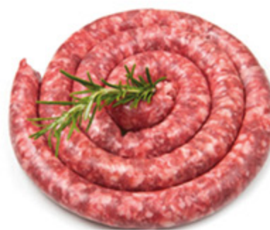
SALSICCIA DI SUINO AL KG