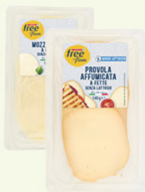
Mozzarella a fette/ Provola affumicata a fette Despar Free From 140g