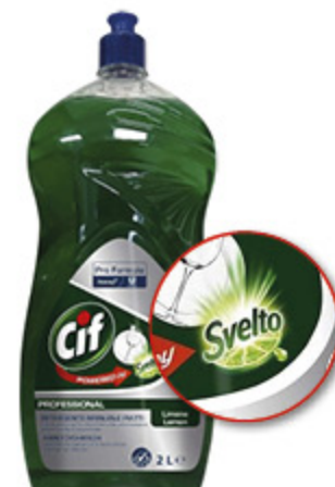
DETERGENTE PIATTI CIF CON SVELTO 2L