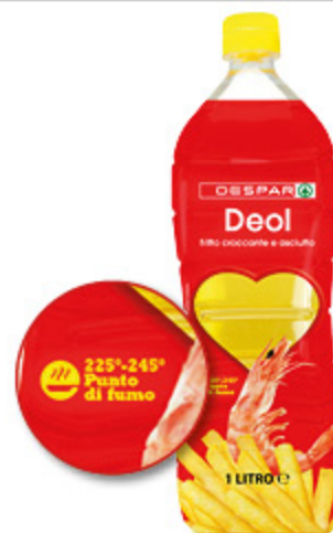
OLIO PER FRITTURA DEOL DESPAR 1L