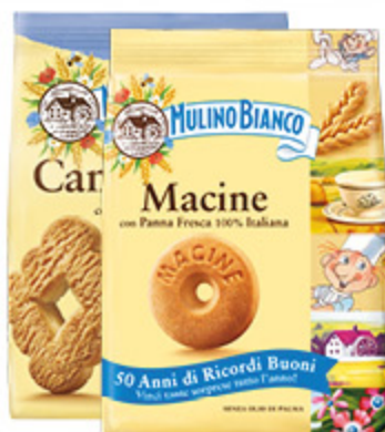
BISCOTTI CLASSICI MULINO BIANCO VARI TIPI 700/800/900G