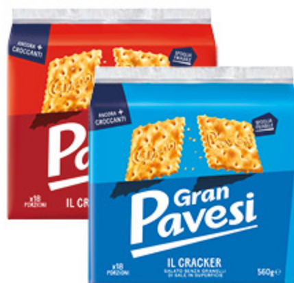
CRACKERS GRAN PAVESI SALATI/ SENZA SALE 560G