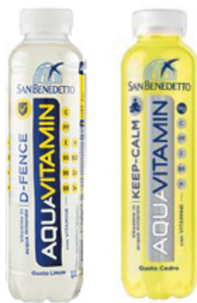
ACQUAVITAMIN SAN BENEDETTO VARI TIPI 40CL