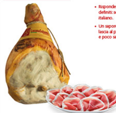
PROSCIUTTO CRUDO LUCANA SALUMI ALL'ETTO