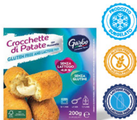
CROCCHETTE DI PATATE CON MOZZARELLA GARBO 200G