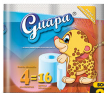
CARTA IGIENICA GUAPA X4