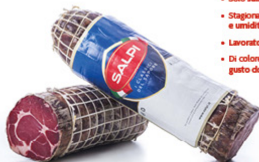
CAPOCOLLO DOLCE SALPI ALL'ETTO