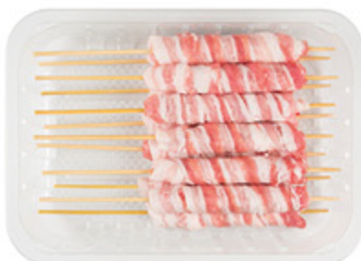
ARROSTINI GOLOSINI AL KG

Filieri controllate, verifiche accurate e tutta la freschezza che cerchi: ecco perché di Despar Passo dopo Passo ti puoi fidare. Qualità, bontà e trasparenza per i prodotti che scegli.