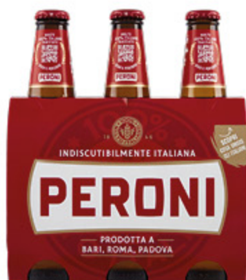
BIRRA PERONI 33CL X3