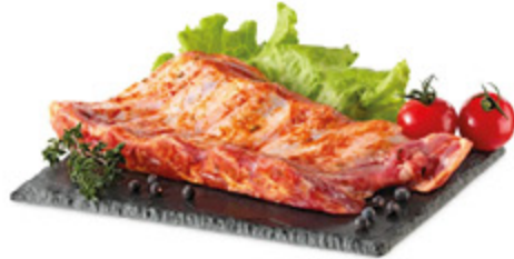
COSTINE MARINATE AL KG