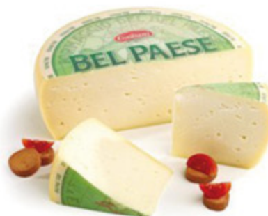
FORMAGGIO BEL PAESE GALBANI ALL'ETTO