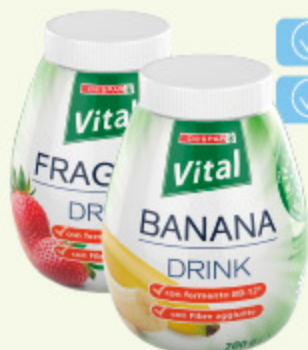
Drink Despar Vital vari gusti 200g