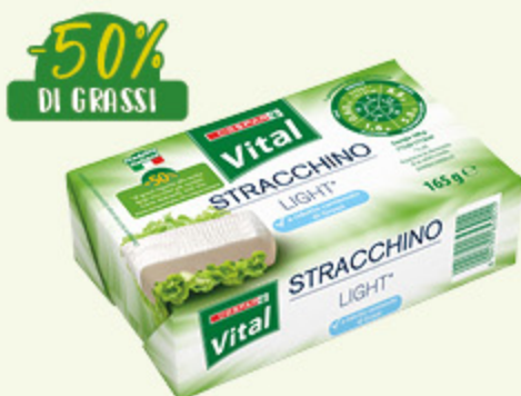
Stracchino light Despar Vital 165g