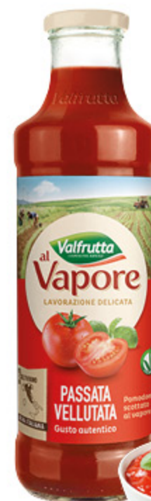
PASSATA VELLUTATA VALFRUTTA AL VAPORE 700G