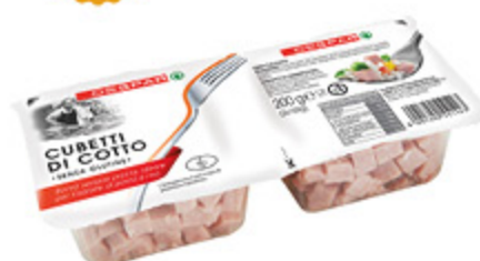
CUBETTI DI COTTO DESPAR 200G