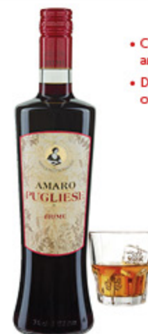
AMARO PUGLIESE 70CL