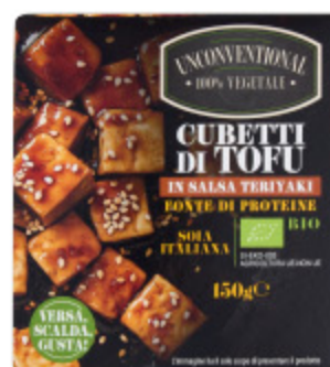
CUBETTI DI TOFU UNCONVENTIONAL IN SALSA TERIYAKI 150G