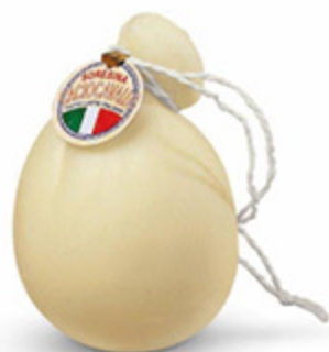
CACIOCAVALLO SORESINA ALL'ETTO