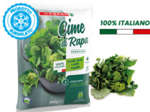
CIME DI RAPE SURGELATE DESPAR 400G