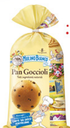
PAN GOCCIOLI MULINO BIANCO X8 - 336G