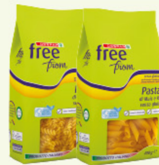
Pasta Despar Free From senza glutine varie trafile 400g