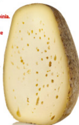
FORMAGGIO SCHIENA D'ASINO GIOVANE CASEIFICIO D&D ALL'ETTO