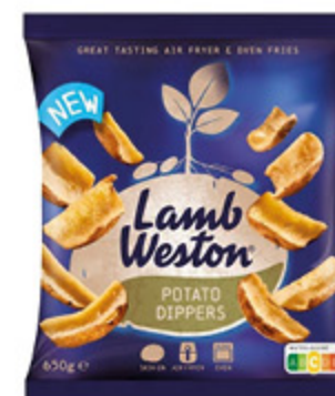
POTATO DIPPERS LAMB WESTON 650G