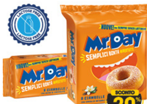
CIAMBELLE MR. DAY CLASSICHE X8 - 304G/ CIOCCOLATO X6 - 288G

100% GRANO ITALIANO SCONTO 25% 1,19 / 4,76 € al kg