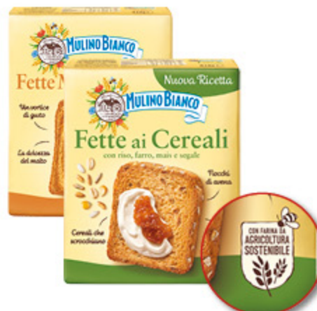
FETTE BISCOTTATE MULINO BIANCO MALTO D'ORZO/ AI CEREALI/ DOLCIFETTE 315G