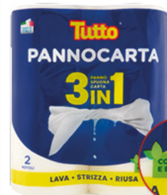
PANNOCARTA 3 IN 1 TUTTO CUCINA X2 ROTOLI