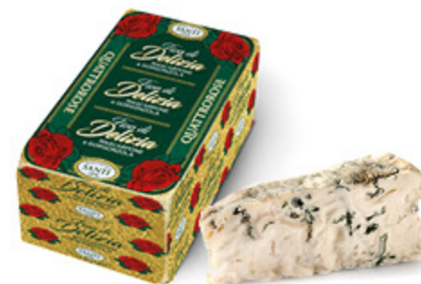
GORGONZOLA & MASCARPONE QUATTRO ROSE SANTI FIORI DI DELIZIA ALL'ETTO