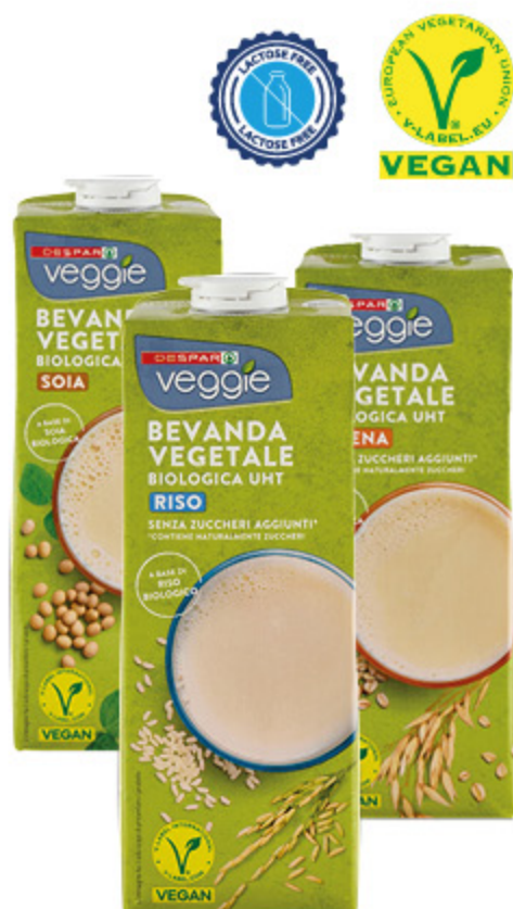
BEVANDA VEGETALE BIOLOGICA DESPAR VEGGIE VARI TIPI 1L