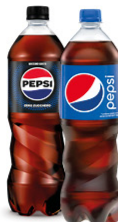
BIBITA PEPSI COLA CLASSICA/ ZERO ZUCCHERO 1L