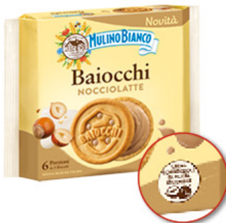
BAIOCCHI MULINO BIANCO NOCCIOLATTE X6 - 168G