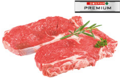
TAGLIATA DI SCOTTONA (BOVINO ADULTO) DESPAR PREMIUM AL KG