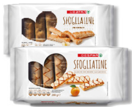
SFOGLIATINE DESPAR ZUCCHERATE/ GLASSATE 200G