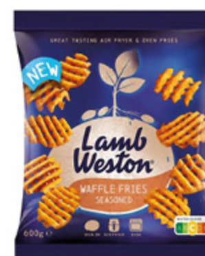
WAFFLE FRIES LAMB WESTON 600G