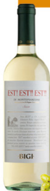
VINO ESTI! ESTI! ESTI! DOC BIGHI MONTEFIASCONE 75CL