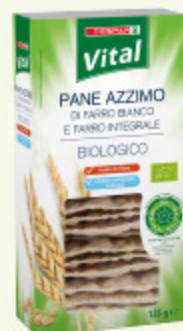
Pane azzimo di farro biologico Despar Vital 125g