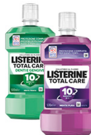
COLLUTORIO LISTERINE VARI TIPI 500ML