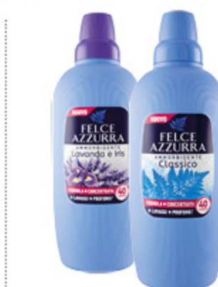
AMMORBIDENTE FELCE AZZURRA VARI TIPI 40 LAVAGGI - 2L