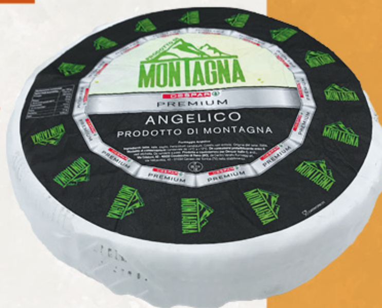
FORMAGGIO ANGELICO DI MONTAGNA DESPAR PREMIUM ALL'ETTO