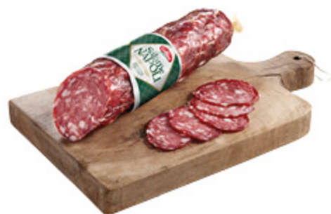
SALAME NAPOLI GALBANI ALL'ETTO