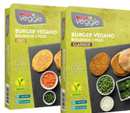
PREPARATI VEGANI DESPAR VEGGIE VARI TIPI 160/200G