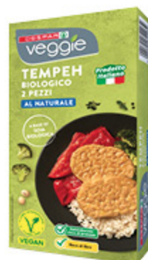
TEMPEH BIOLOGICO DESPAR VEGGIE AL NATURALE X2 - 150G