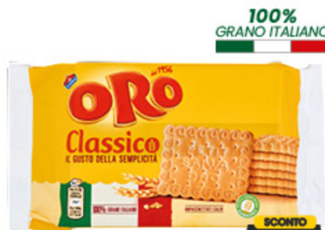
BISCOTTI ORO SAIWA 250G

100% GRANO ITALIANO SCONTO 25% 1,19 / 4,76 € al kg