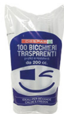
100 BICCHIERI TRASPARENTI DESPAR 200 CC