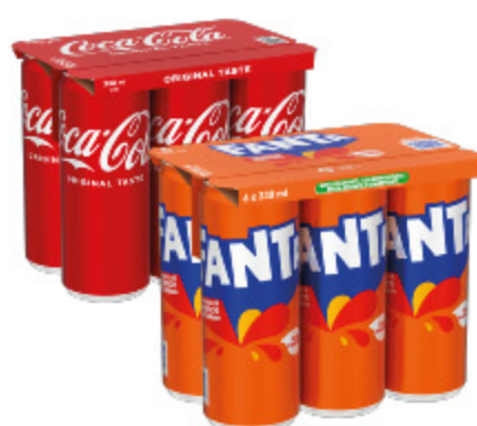
COCA COLA VARI TIPI/ FANTA/SPRITE VARI TIPI 33CL X6