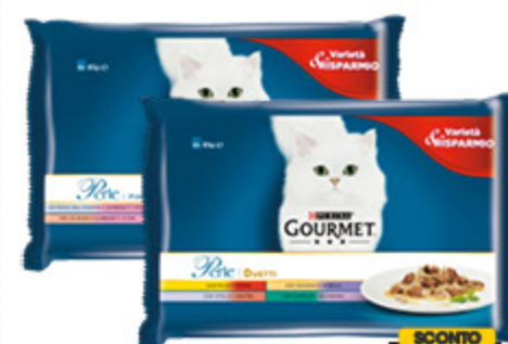
CIBO PER GATTI PERLE PURINA GOURMET VARI TIPI 85G X4