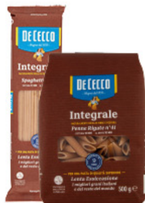
PASTA INTEGRALE DE CECCO VARI TIPI 500G