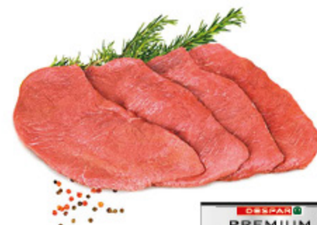
FETTINE SCELTISSIME DI SCOTTONA (BOVINO ADULTO) DESPAR PREMIUM AL KG