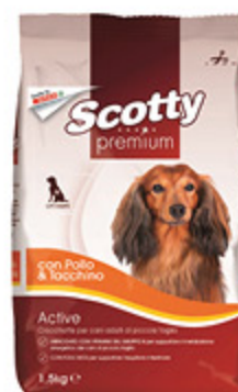
CROCCETTE SCOTTY PREMIUM CON POLLO E TACCHINO 1,5KG