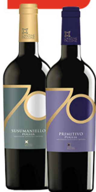
VINI PUGLIA IGP CANTINE FALCONE PRIMITIVO/ SUSUMANIELLO 75CL