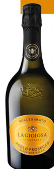
ASOLO PROSECCO SUPERIORE D.O.C.G. LA GIOIOSA MILLESIMATO 75CL