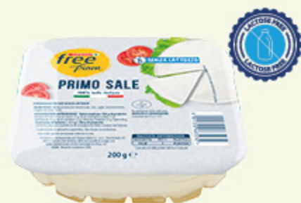
Primo sale Despar Free From 200g