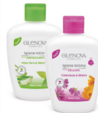
DETERGENTE INTIMO GLENNOVA CALENDULA E MALVA/ALOE E MENTOLO 300ML