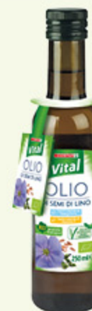
Olio di semi di lino biologico Despar Vital 250ml