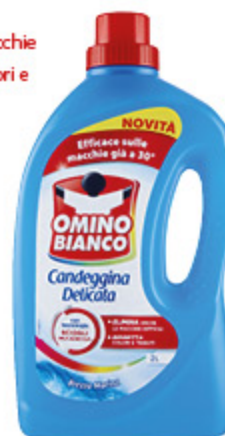
CANDEGGINA DELICATA OMINO BIANCO VARIE PROFUMAZIONI 2L