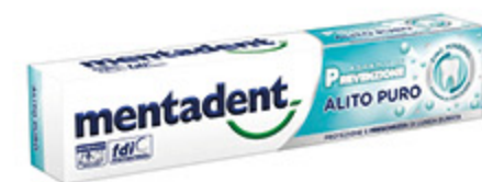
DENTIFRICIO MENTADENT VARI TIPI 75ML