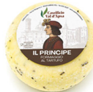
FORMAGGIO AL TARTUFO IL PRINCIPE CASEIFICIO VAL D'APSA ALL'ETTO