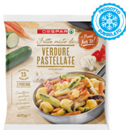
VERDURE PASTELLATE DESPAR 450G