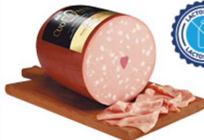
MORTADELLA CUOR DI PAESE IBIS ALL'ETTO