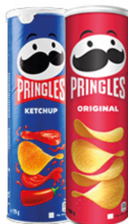
PRINGLES VARI GUSTI 160G/ 165G/175G