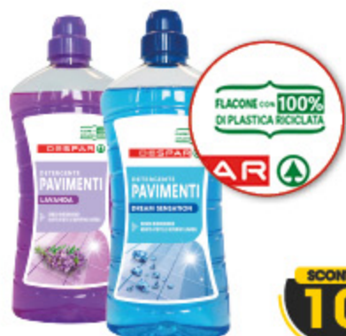
DETERGENTE PAVIMENTI DESPAR VARIE PROFUMAZIONI 1L