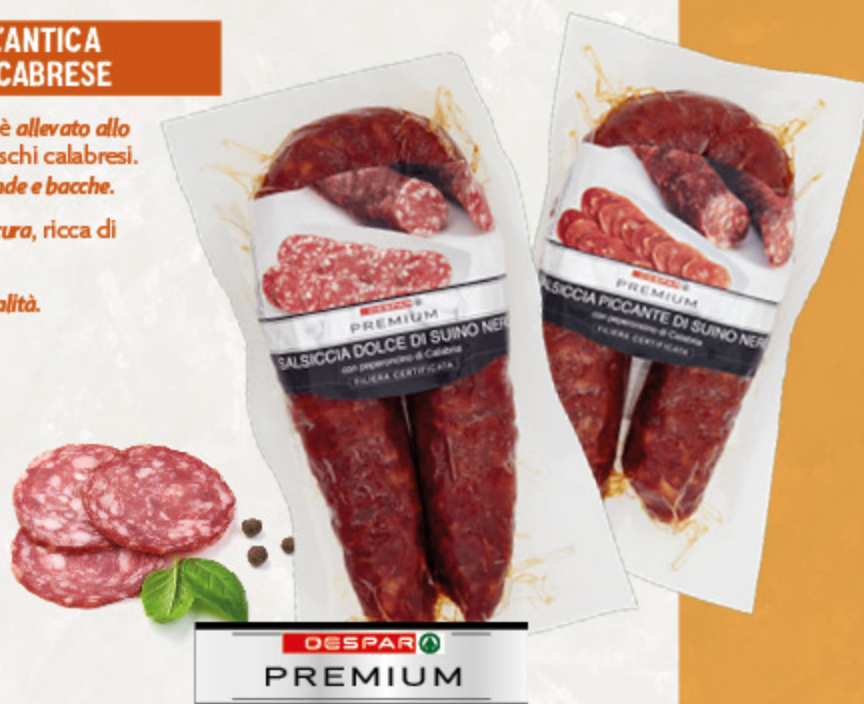
SALSICCIA DI SUINO NERO DESPAR PREMIUM DOLCE/PICCANTE 300G