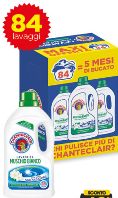
DETERSIVO LIQUIDO PER LAVATRICE CHANTECLAIR 28 LAVAGGI X3