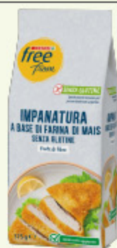
Impanatura senza glutine Despar Free From 375g