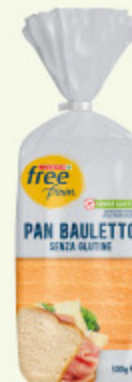
Pane a fette Despar Free From senza glutine 300g

Le tue scelte di benessere sono firmate Despar grazie a tanti prodotti pensati per ogni tipo di alimentazione: che sia vegetariana, vegana, senza glutine, senza lattosio o ricca di nutrienti, con Despar il gusto e la qualità sono assicurati!