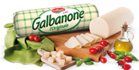
GALBANONE GALBANI L'ORIGINALE/ L'AFFUMICATO ALL'ETTO