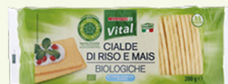
Cialde di riso e mais biologiche Despar Vital x10 - 200g