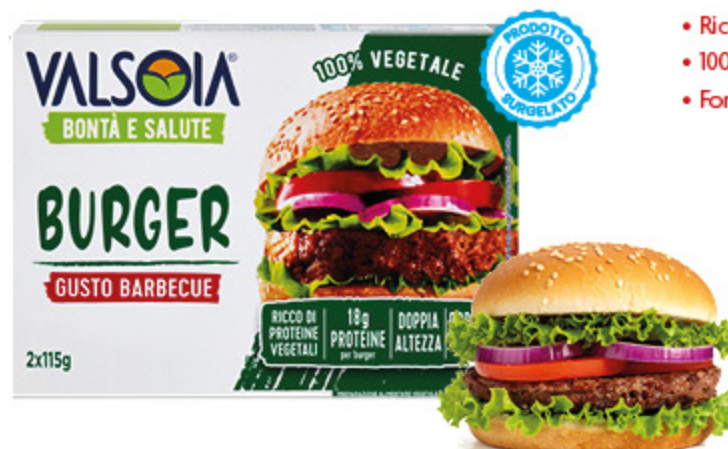
BURGER VALSOIA GUSTO BARBECUE 115G X2