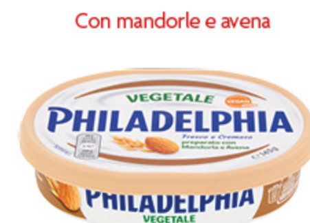
PHILADELPHIA VEGETALE 145G