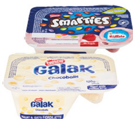
YOGURT SMARTIES/ GALAK NESTLÉ VARI TIPI 120G