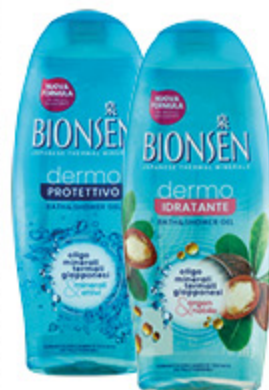
BAGNOSCHIUMA BIONSEN IDRATANTE/ PROTETTIVO 650ML