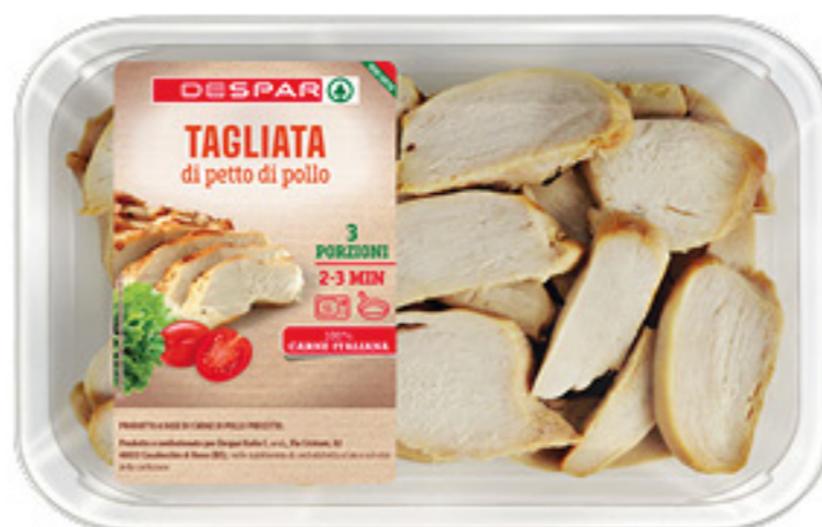
TAGLIATA DI POLLO DESPAR 280G