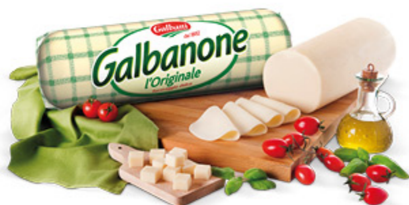
GALBANONE GALBANI CLASSICO/AFFUMICATO ALL'ETTO