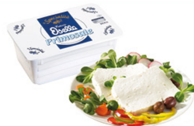
PRIMOSALE OSELLA ALL'ETTO