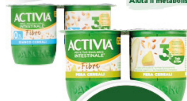
ACTIVA VARI GUSTI 125G X4