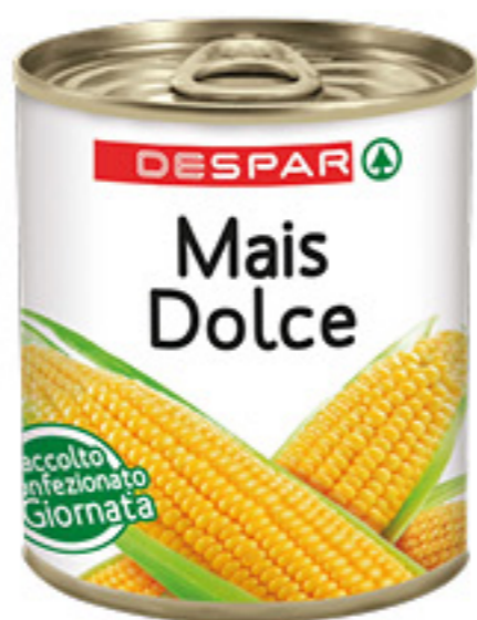
MAIS DOLCE DESPAR 340G