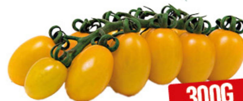
POMODORI DATTERINO GIALLO DESPAR PASSO DOPO PASSO 300G

Il pomodorino datterino giallo è un'aggiunta eccellente per le insalate, noto per il suo sapore dolce, la bassa acidità e la consistenza succosa. È ideale crudo per arricchire piatti estivi, portando una nota di colore e freschezza.