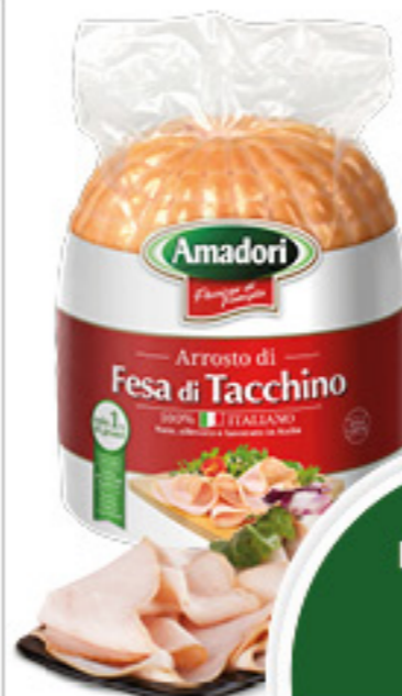
ARROSTO DI FESA DI TACCHINO AMADORI ALL'ETTO