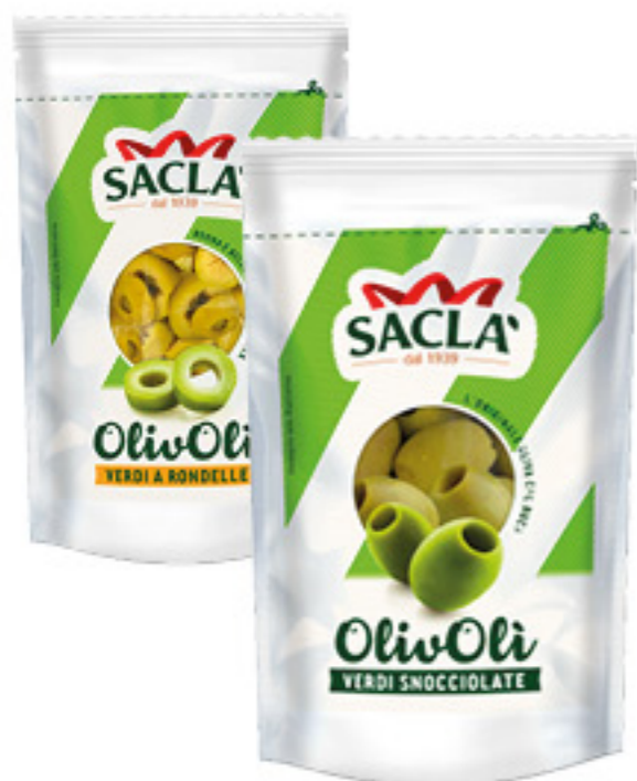
OLIVOLI SNOCCIOLATE SACLA' 185G