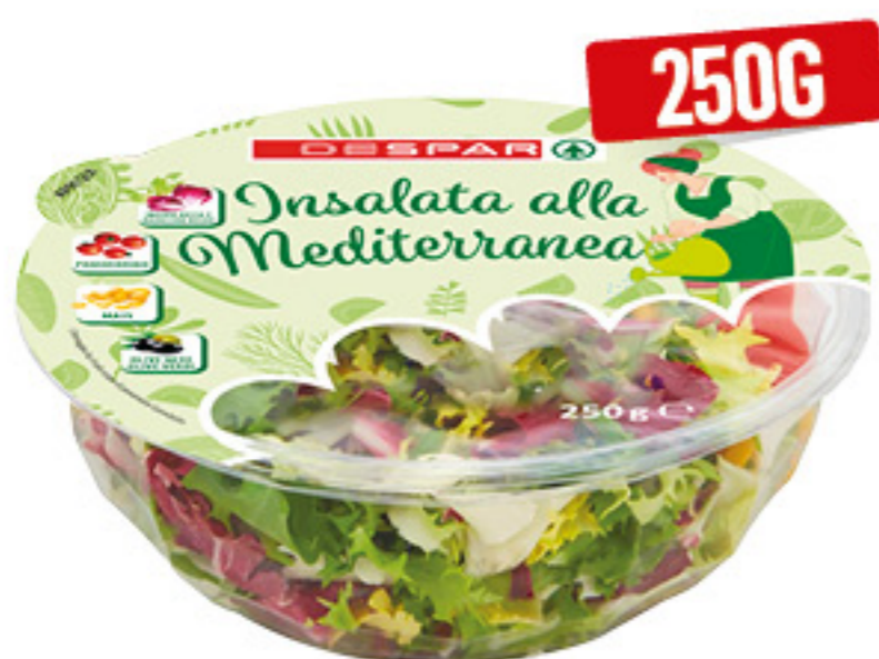
INSALATA ALLA MEDITERRANEA DESPAR 250G