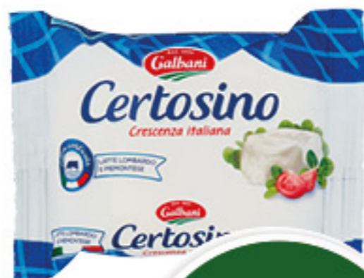
CERTOSINO GALBANI 100G