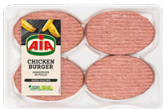
HAMBURGER DI POLLO AIA X4 - 400G