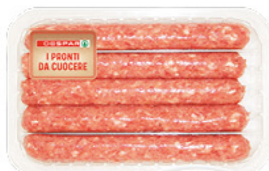
SALSICCIA DI POLLO DESPAR 450G