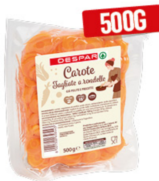
CAROTE TAGLIATE A RONDELLE DESPAR 500G