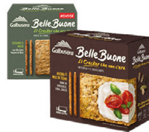
CRACKERS BELLEBUONE GALBUSERA VARI TIPI 200G