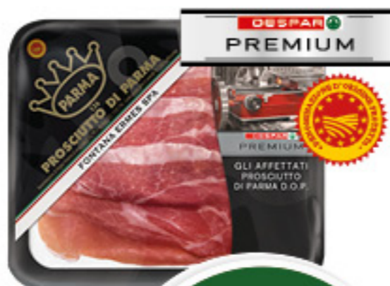
PROSCIUTTO DI PARMA DOP DESPAR PREMIUM 100G

Per il tuo equilibrio intestinale Fonte di calcio e fibre Aiuta il metabolismo