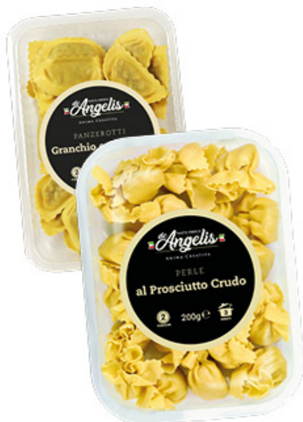
PASTA FRESCA RIPIENA DE ANGELIS VARI TIPI 200G