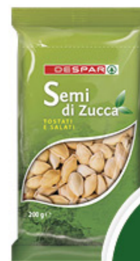
SEMI DI ZUCCA DESPAR TOSTATI E SALATI 200G