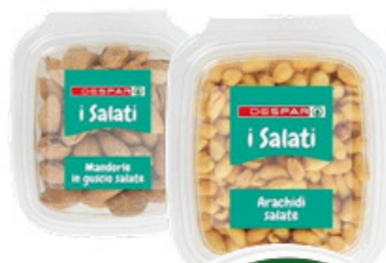
ARACHIDI SALATE 200G/ MANDORLE IN GUSCIO 100G DESPAR