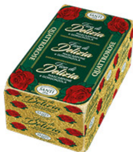
GORGONZOLA E MASCARPONE FIORI DI DELIZIA QUATTRORE ALL'ETTO