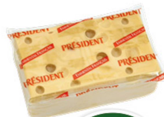
EMMENTAL FRANCESE PRESIDENT ALL'ETTO