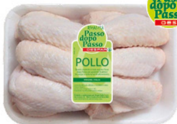
ALETTE DI POLLO PASSO DOPO PASSO DESPAR AL KG