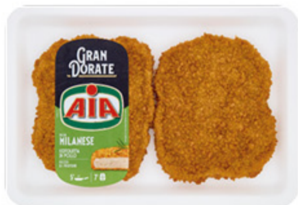
COTOLETTA DI POLLO ALLA MILANESE AIA 280G