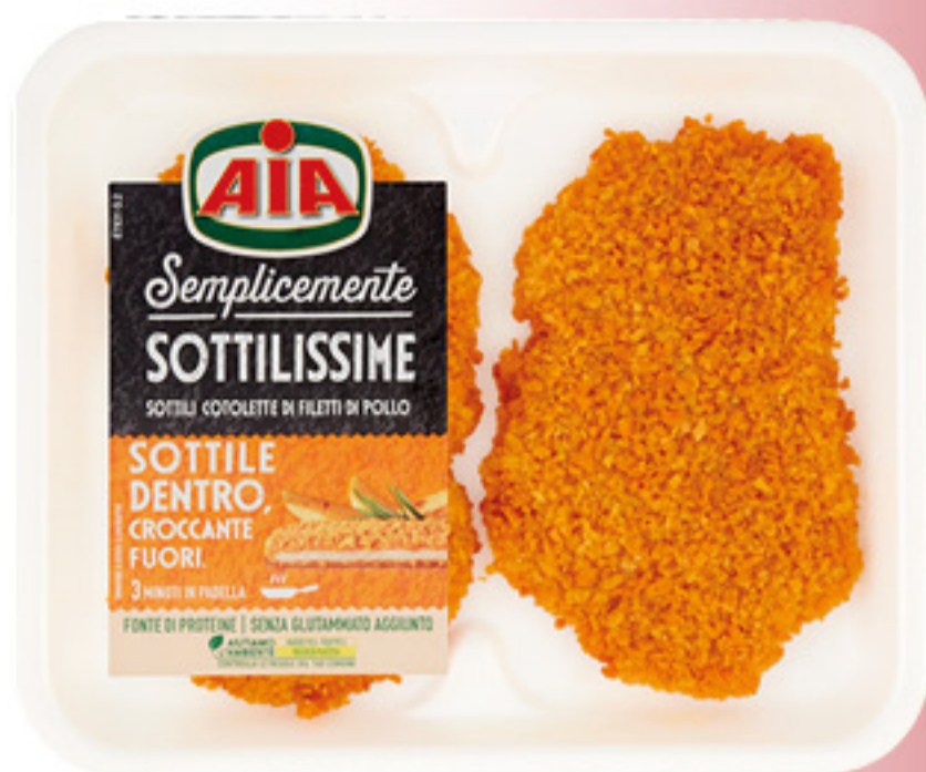
COTOLETTE DI FILETTI DI POLLO SOTTILISSIME AIA 140G