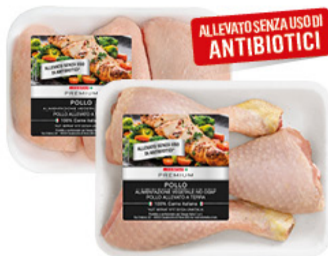
FUSI/SOVRACOSCE DI POLLO DESPAR PREMIUM AL KG