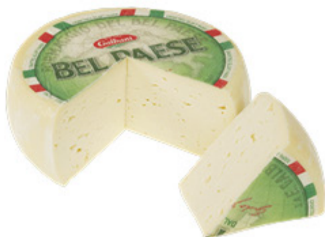
FORMAGGIO BEL PAESE GALBANI ALL'ETTO