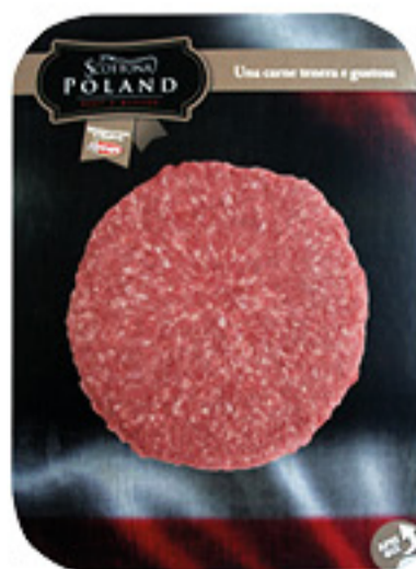
MAXI BURGER DI SCOTTONA (BOVINO ADULTO) POLAND 200G