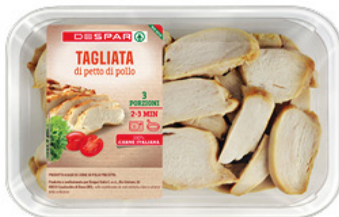
TAGLIATA DI PETTO DI POLLO DESPAR 280G