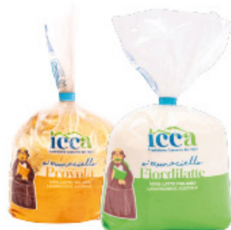
FIORDILATTE/ PROVOLA O 'MUNACIELLO ICCA ALL'ETTO