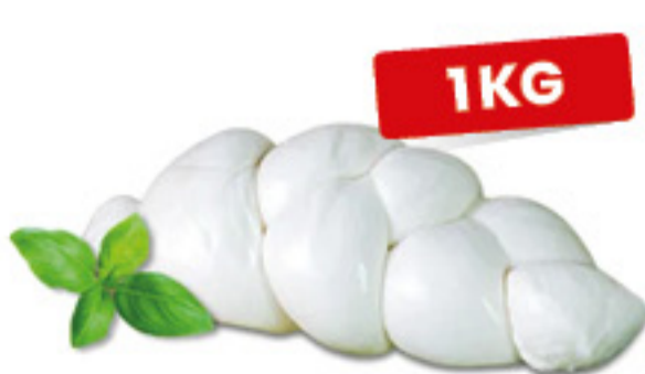
TRECCIONE DI MOZZARELLA BELLA MURGIA 1KG