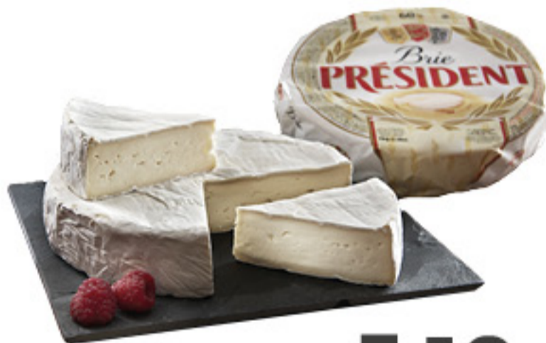
BRIE PRÉSIDENT ALL'ETTO