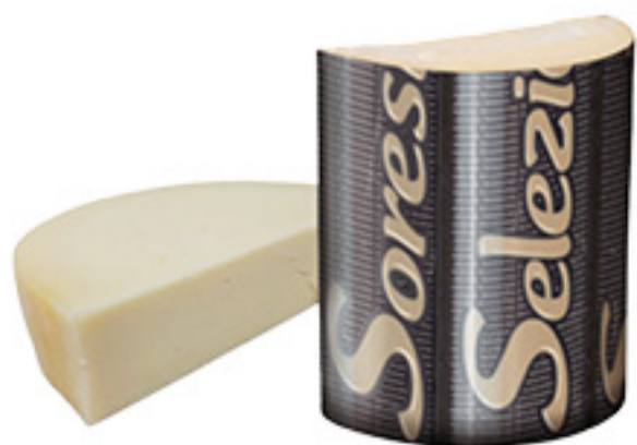
PROVOLONE SORESINA PICCANTE ALL'ETTO