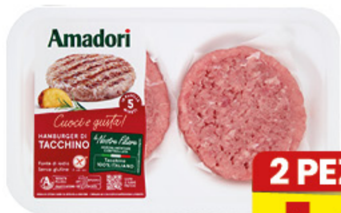
HAMBURGER DI TACCHINO AMADORI 160G