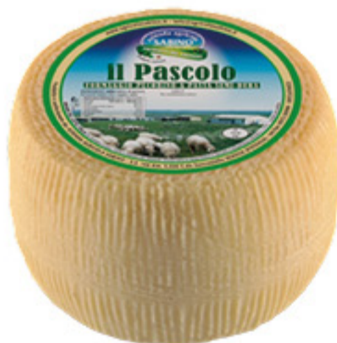
PECORINO AGRITURISMO SABINO IL PASCOLO ALL'ETTO