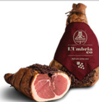
PROSCIUTTO CRUDO NAZIONALE L'UMBRIACO RENZINI