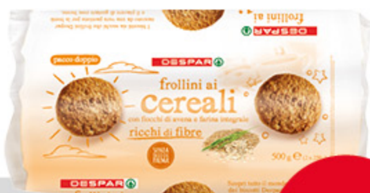
Frollini ai cereali DESPAR 500g