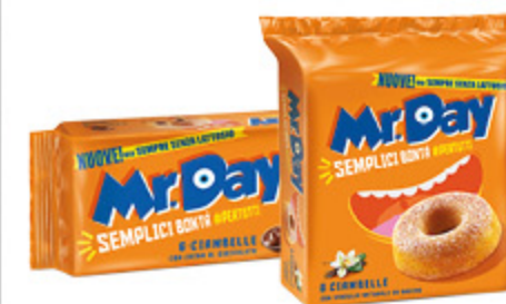
CIAMBELLE MR. DAY CLASSICHE 300G/ CIOCCOLATO 320G