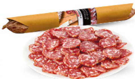
SALAME STROLGHINO PREMIUM