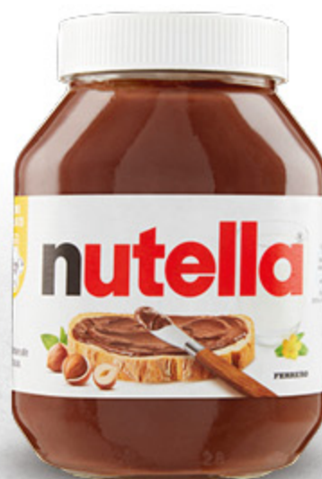
NUTELLA FERRERO 950G