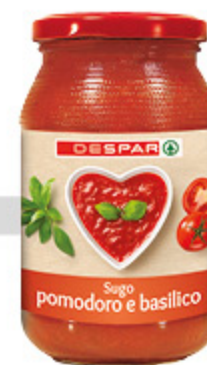
Sugo Despar pomodoro e basilico 400g