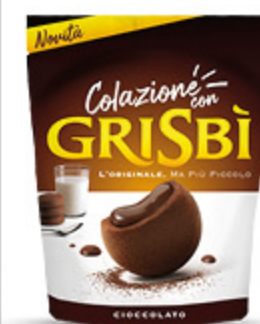
COLAZIONE CON GRISBI AL CIOCCOLATO 250G