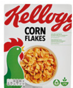
CORN FLAKES KELLOGG'S 375G