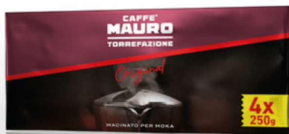
CAFFÈ MAURO ORIGINAL 250G X4