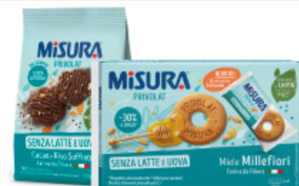
BISCOTTI PRIVOLAT MISURA VARI TIPI 290G/400G