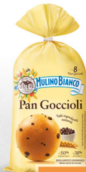
PAN GOCCIOLI MULINO BIANCO 336G