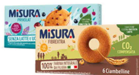
TORTINE PRIVOLAT MISURA 290G/ CIAMBELLINE INTEGRALI MISURA FIBREXTRA VARI TIPI 230G