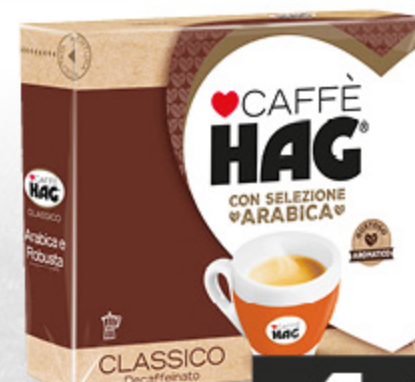
CAFFÈ HAG CLASSICO 250G X2