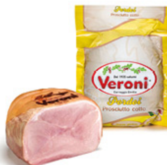
PROSCIUTTO COTTO PORDOI VERONI