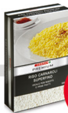
Riso carnaroli Premium 1kg